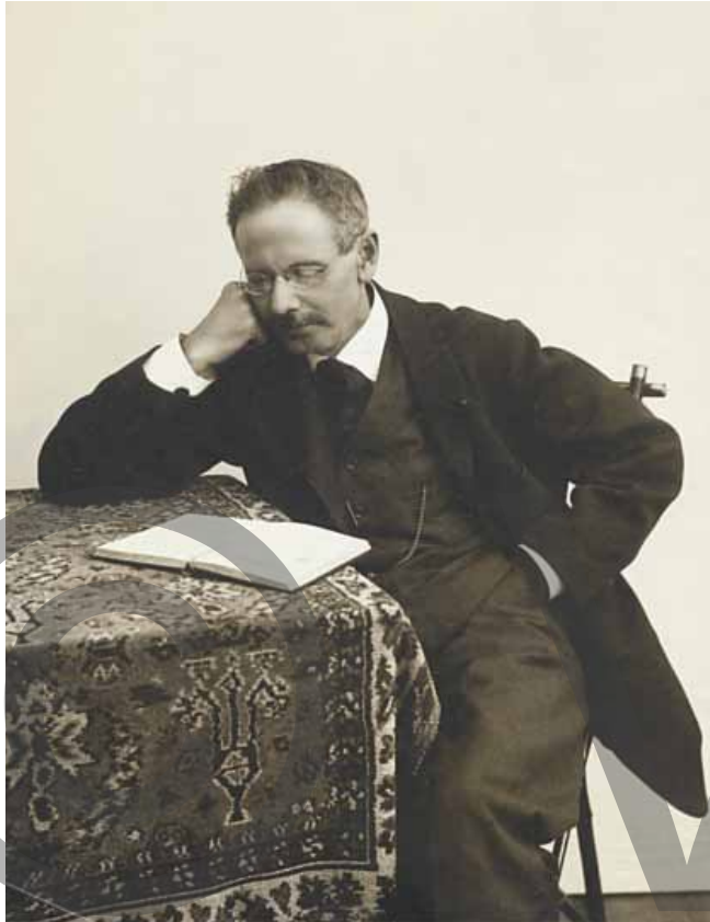
Peter Rosegger, 1880er Jahre.